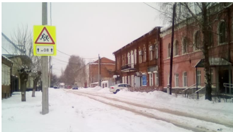
Фото подхода к образовательной организации